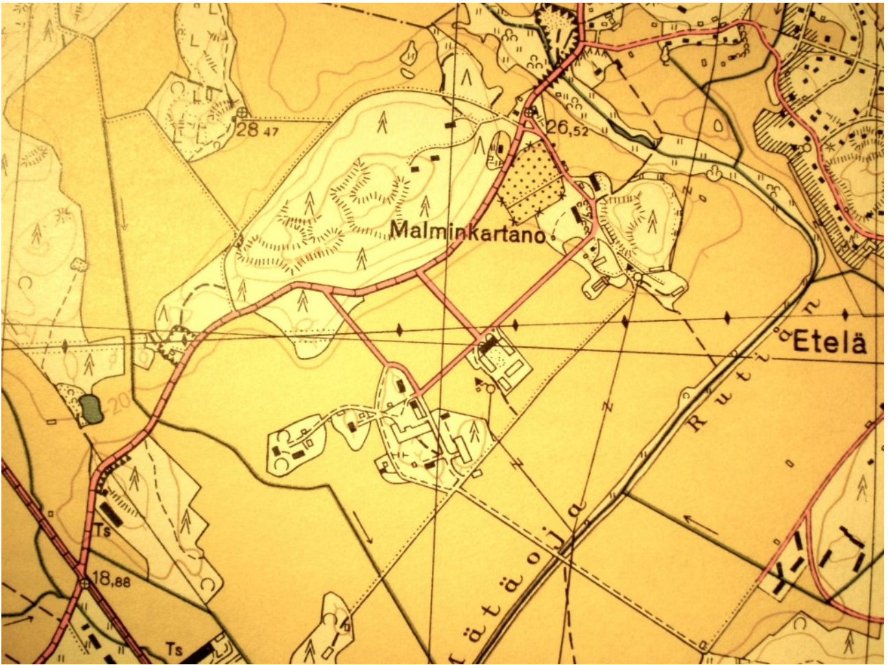
MALMINKARTANO MUISTIKUVIENI MUKAAN 1940-LUVUN LOPULLA