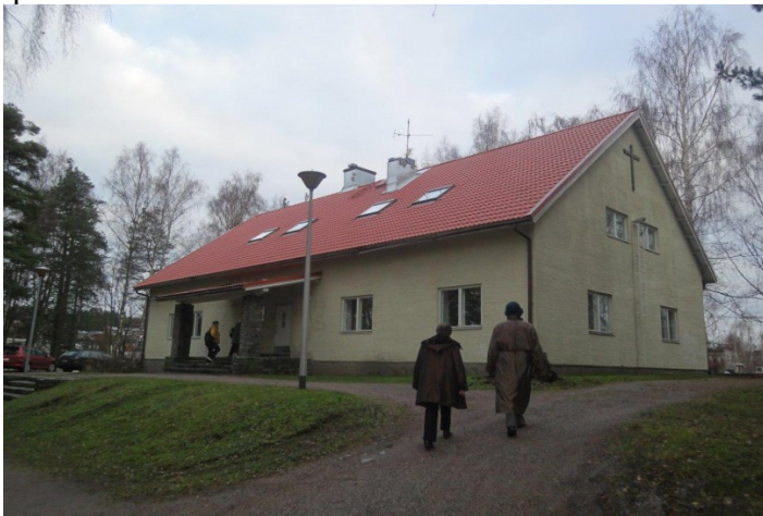
Malminkartanon lapsuudenkotini, sittemmin seurakuntakoti ( kuva 2011) ja nykyisin kappeli.